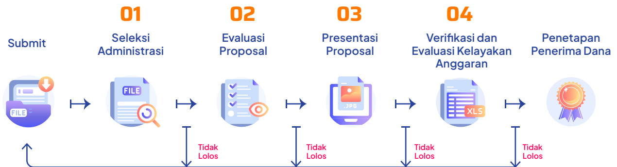
Gambar 1. Alur Mekanisme Seleksi Program Dana Padanan Tahun 2025

Mekanisme seleksi dilaksanakan untuk mendapatkan proposal terbaik sesuai dengan kriteria evaluasi yang ditetapkan dalam panduan ini. Mekanisme seleksi mencakup evaluasi kelengkapan administrasi proposal, kelayakan substansi proposal, serta kelayakan dan kewajaran usulan anggaran. Mekanisme dilaksanakan secara bertahap seperti pada gambar berikut.